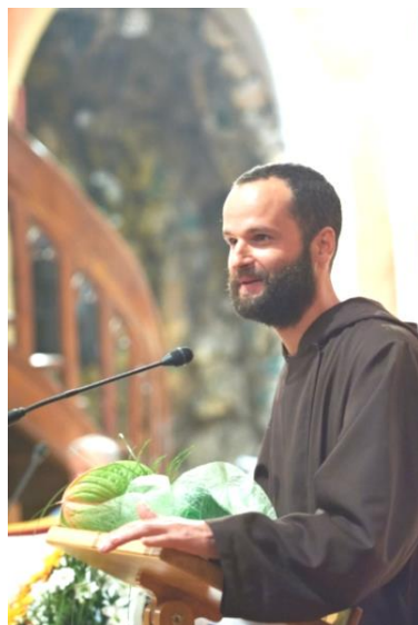
Sveti Frančišek Asiški – prosi za nas!

Bodi njegova tolažba, njegovo veselje in njegova moč, še posebej pa mu pomagaj, da bo vedno živel v skladu z ideali duhovniškega posvečenja. Amen.